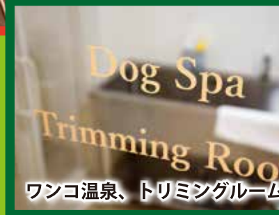
ワンコ温泉、トリミングルーム