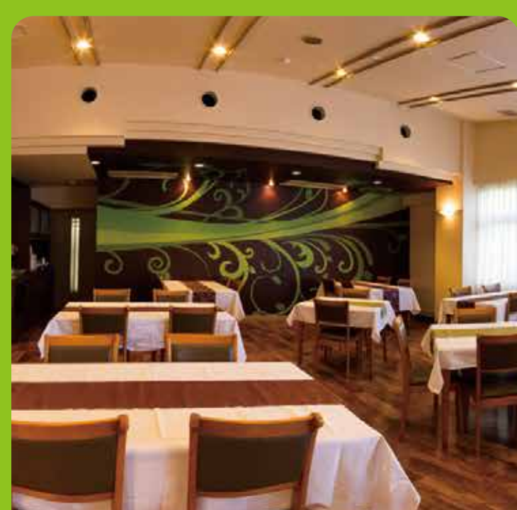
元箱根温泉 × アートな空間