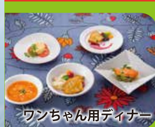
ワンちゃん用ディナー