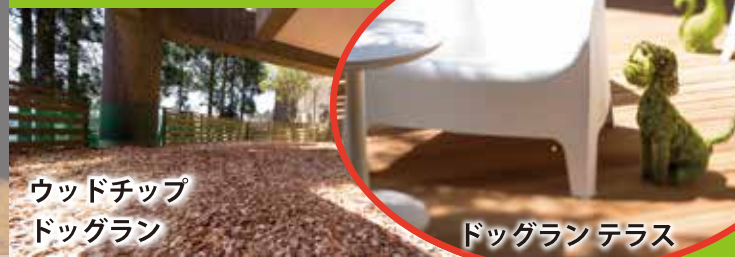
ウッドチップ ドッグラン